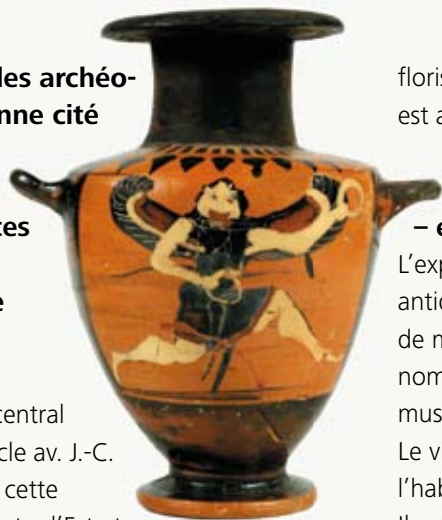
Hydrie avec Gorgone 550–525 av. J.-C. Ath nes, Mus e arch ologique national

Er trie, sur l' le d'Eub e, joue un r le central dans la colonisation grecque du 8  si cle av. J.-C. et dans les  changes commerciaux de cette  poque. La cit  devient un carrefour entre l'Est et l'Ouest. Elle contribue en particulier   diffuser l' criture jusqu'en Italie. Er trie conna t une seconde p riode