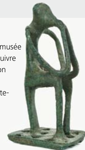
Figurine assise en bronze 750–700 av. J.-C. Er trie, Mus e arch ologique

L'exposition est bilingue allemand/fran ais.